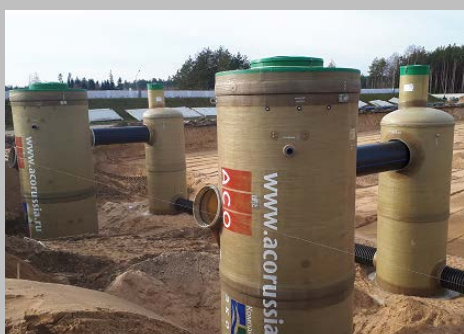
Индустриальный парк "Великий камень" "Оборудование для очистки поверхностного стока в составе ЛОС накопительного типа с самым большим в мире безбетонным аккумулирующим резервуаром АСО StormBrixx, Минск, Республика Беларусь