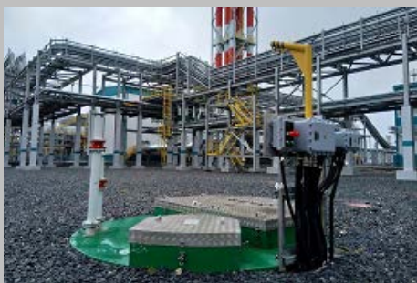
Производство и поставка 30-и комплектных КНС ПАО "СИБУР Холдинг" Западно- Сибирский Нефтехимический комбинат Г. Тобольск